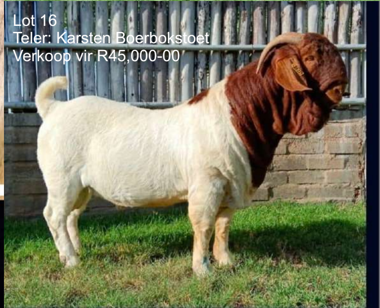
Lot 16 Teler: Karsten Boerbokstoet Verkoop vir R45,000-00

FOR MORE INFORMATION VISIT ANDRÉ KOCK & SON LIVESTOCK AUCTIONNEER/ESTATE AGENT FACEBOOK PAGE.