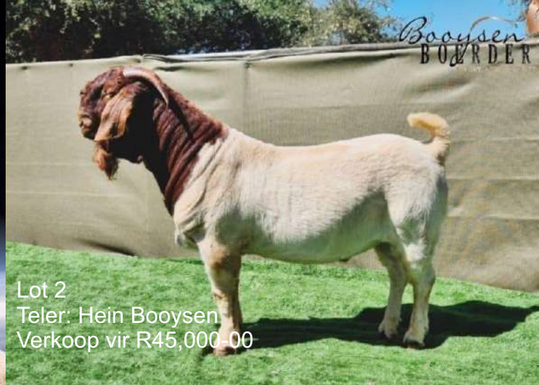
Lot 2 Teler: Hein Booysen Verkoop vir R45,000-00