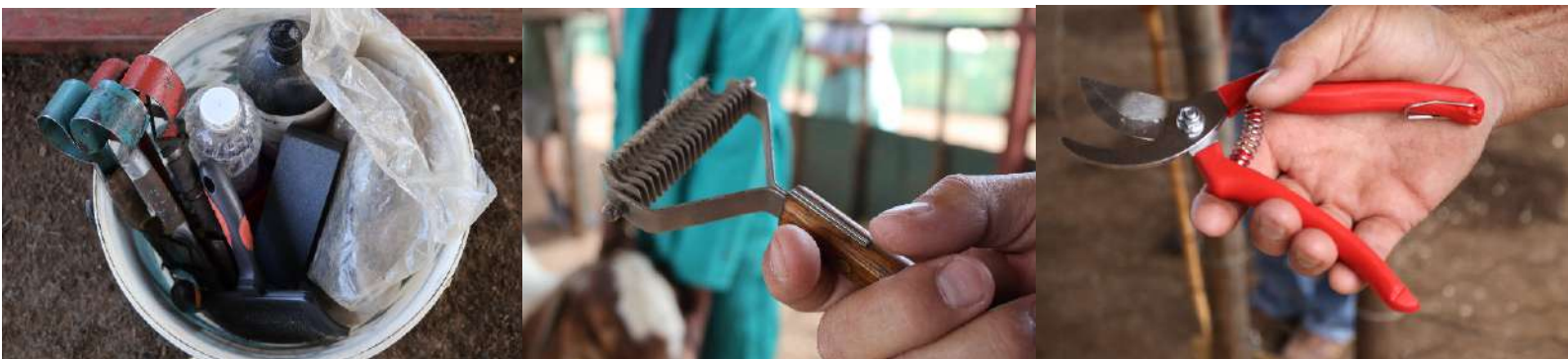
Prakties aangebied deur Hennie le Roux

As u bokke goeie en korrekte bouvorm, groei vermoë, grootte en goeie bene het, kan u hulle komplimenteer met goeie kondisie en sal hulle pryse kry. As dit nie die geval is nie, kan u hulle voer tot volgende jaar en u sal nie sommer 'n prys wen nie. (Feeding is half the breeding, but never forget the breeding!)